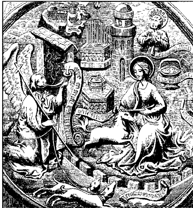
JEDNOROZEC PRENASLEDOVANÝ LOVECKÝMI PSAMI NACHÁDZA ÚTOČISKO NA PRSIACH PANNY. LOVCOM JE GABRIEL, ANJEL ZVESTOVANIA, PSI SÚ CNOSTI - MILOSRDENSTVO, SPRÁVODLIVOSŤ A MIER - KTORÉ SPREVÁDZAJÚ KRISTOV PRÍCHOD

A zase úplne inak sa dotýka našej duše ráno, pred svitaním. Luna ubúdajúca, odchádzajúca. Na sklonku noci, pred svitaním, keď ešte na oka-